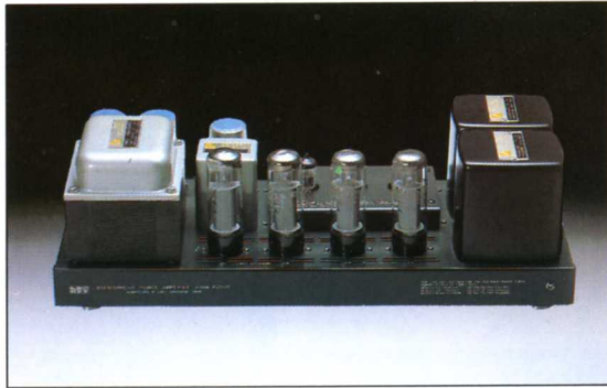
パワーアンプ・キット

●使用真空管/12A×7(4), 12AU7(4) ●定格出力/2V ●歪率/0.008%以下 ●周波数特性/3～70,000Hz ●入力感度/phono:1, -2; 2mV, tuner:aux; 170mV ●SN比(IHF-A補正)/phono:80dB, tuner:ex; 100dB ●寸法・重量/438(W)×77(H)×322(D)mm・6.4kg