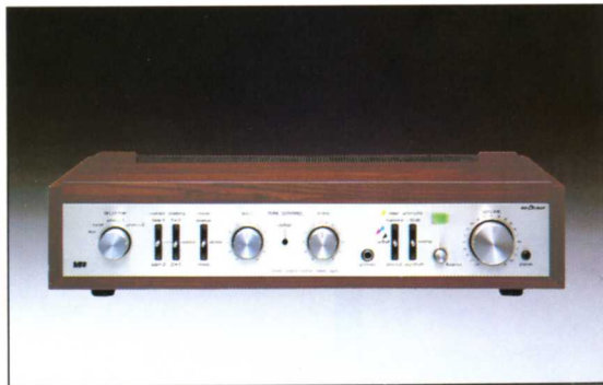
コントロールアンプ・キット