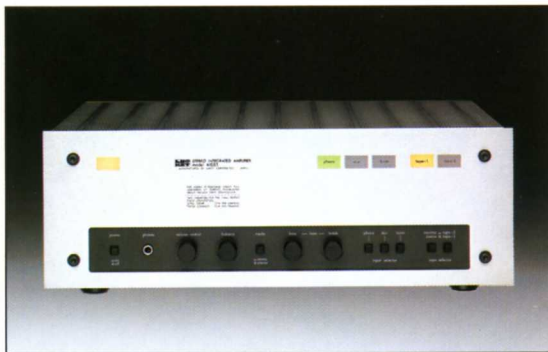
プリメイン・キット

●使用真空管/6CA7(4), 6AQ8(3) ●実効出力/40W×2(UL接続時), 20W×2(3結時) ●歪率/0.5%以下(1kHz) ●周波数特性/20～20,000Hz ●入力感度/約900mV(UL接続時) ●外形寸法/465(W)×260(D)×168(H)mm ●重量/16kg(ポネット付)