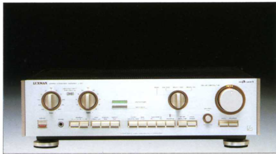
インテグレートッドアンプ

●実効出力 / 63W + 63W (8Ω 1kHz 両ch) ●歪率 / 0.02%以下 ●入力感度 / phono (MM): 1.8mV, (MC): 250μV, tuner, aux / DAD, monitor; 160mV ●入力インピーダンス / phono (MM): 50kΩ, (MC): 100Ω, tuner, aux / DAD, monitor; 40kΩ ●SN比 (IHF-A) / phono (MM): 90dB, (MC): 67dB, tuner, aux / DAD, monitor; 105dB ●寸法・重量 / 453(W) × 111(H) × 321(D)mm - 7.6kg