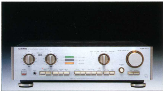
インテグレートッドアンプ