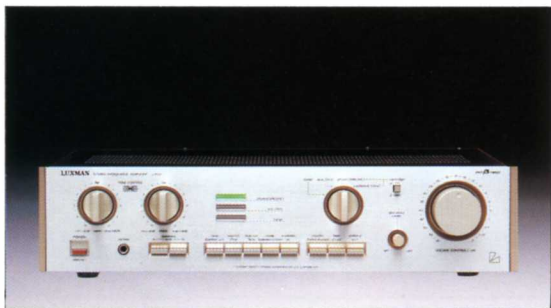
インテグレートッドアンプ

●実効出力 / 105W + 105W (8Ω 1kHz 両ch) ●歪率 / 0.009%以下 ●入力感度 / phono (MM): 2.5mV, (MC): 100μV, tuner, aux / DAD, monitor, main-in; 200mV ●入力インピーダンス / phono (MM): 50kΩ, (MC): High-Low切替, tuner, aux / DAD, monitor; 40kΩ, main-in; 50kΩ ●SN比 (IHF-A) / phono (MM): 90dB, (MC): 67dB, tuner, aux / DAD, monitor, main-in; 110dB ●寸法・重量 / 453(W) × 135(H) × 425(D)mm - 13.5kg