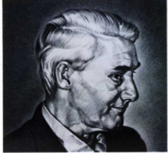
James B. Lansing